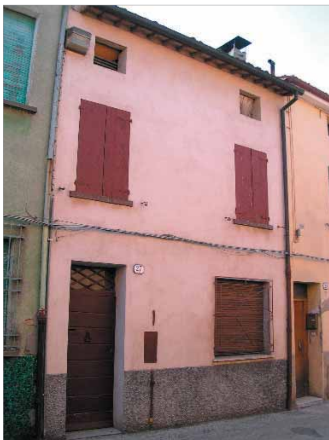
Via Verdi 27 Fronte Principale